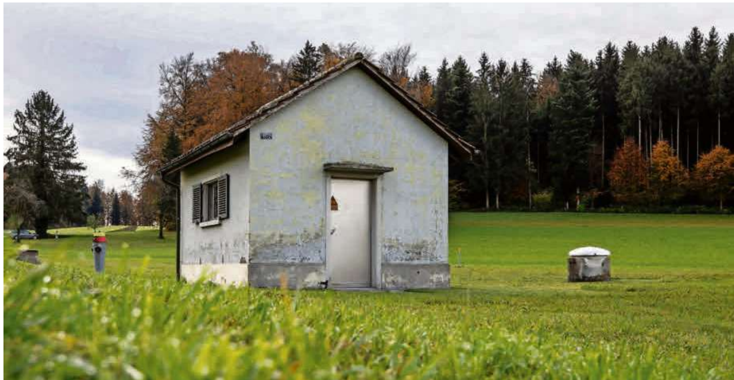
Die Energie Uster hat das Pumpwerk Freudwil bis auf Weiteres ausser Betrieb genommen.

Das Wasser in Freudwil wies mit 0,156 Mikrogramm ebenfalls zu viel Chlorothalonil auf – zusätzlich zum zu hohen Bentazon-Wert. Das Kantonale Labor teilte die Beanstandungen deshalb am 3. Oktober telefonisch der Energie Uster mit. Diese informierte über die zu hohen Messwerte daraufhin auf ihrer Website – ohne jedoch die exakte Höhe und den erlaubten Grenzwert zu nennen. Angaben zur