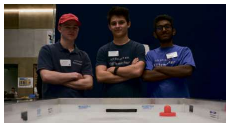
Selbstbewusst präsentieren die Lernenden ihre Projekte.