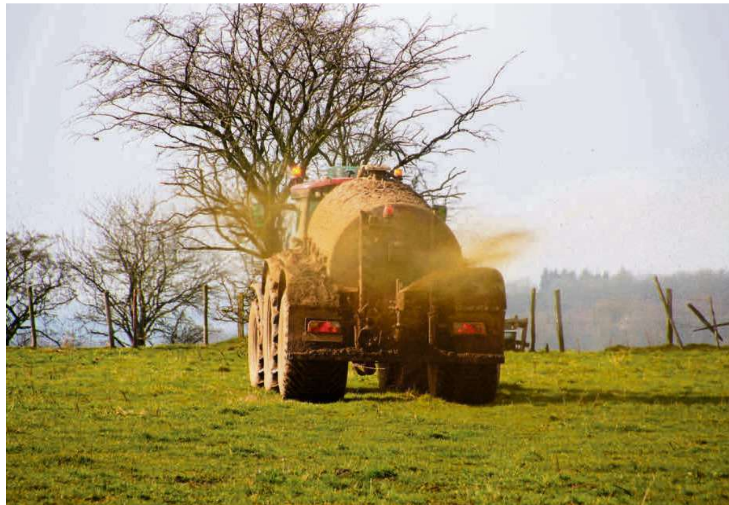
Im Freudwiler Grundwasser wurden Rückstände von Unkrautvertilgungsmitteln entdeckt.

Uster Ein Pumpwerk in Freudwil wurde wegen zu hoher Pflanzenschutzmittel-Rückstände stillgelegt. Damit ist es schon das zweite in der Region.